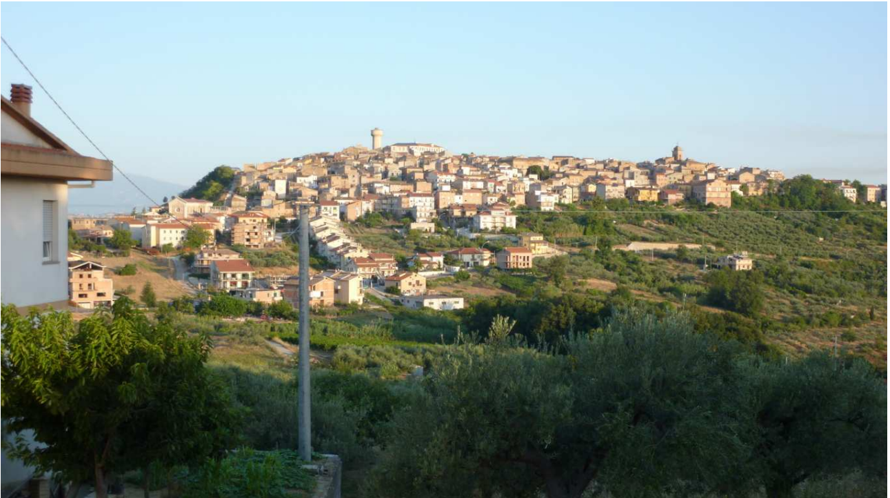
Cupello dalla Strada che sale a Monteodorisio