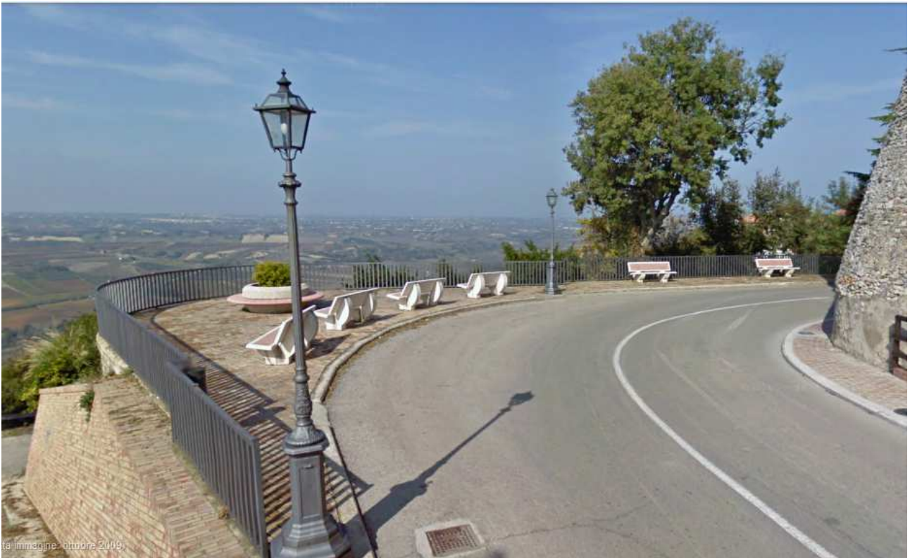
La terrazza da dove si ammira una bellissimo paesaggio. In lontananza si vede Gissi.