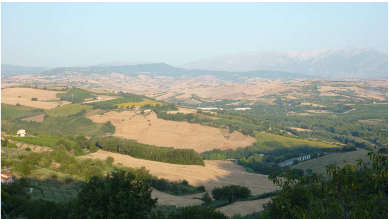
Paesaggio dalla terrazza.